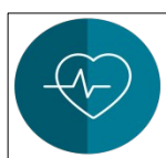
1 pav. Plano „Naujos kartos Lietuva“ komponentai

Atspari grėsmėms ir pasirengusi ateities iššūkiams sveikatos priežiūros sistema