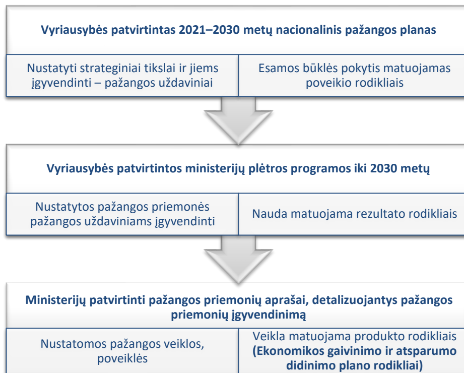
2 pav. Ekonomikos gaivinimo ir atsparumo didinimo plano rodiklių vieta strateginio planavimo sistemoje